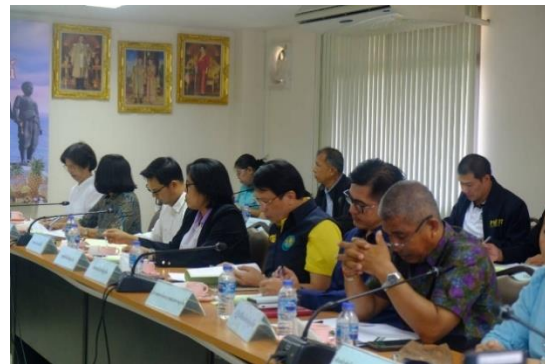
การประชุมคณะอนุกรรมการพัฒนาการเกษตรและสหกรณ์ระดับจังหวัด ครั้งที่ ๑/๒๕๖๗

สำนักงานเกษตรและสหกรณ์จังหวัดภูเก็ตได้ดำเนินการการจัดประชุมคณะอนุกรรมการพัฒนาการเกษตรและสหกรณ์ระดับจังหวัด ครั้งที่ ๑/๒๕๖๗ เมื่อวันที่ ๒๘ กรกฎาคม ๒๕๖๗ เวลา ๐๙.๓๐ น. ณ ห้องประชุมสำนักงานเกษตรและสหกรณ์จังหวัดภูเก็ต มีผู้เข้าร่วมประชุม จำนวน ๔๑ คน ประกอบด้วย รองผู้ว่าราชการจังหวัดภูเก็ต เป็นประธาน หัวหน้าส่วนราชการสังกัดกระทรวงเกษตรและสหกรณ์จังหวัดภูเก็ต รองผู้อำนวยการรักษาความมั่นคงภายในจังหวัดภูเก็ต ผู้บังคับการตำรวจภูธรจังหวัดภูเก็ต ปลัดจังหวัดภูเก็ต หัวหน้าสำนักงานจังหวัดภูเก็ต ท้องถิ่นจังหวัดภูเก็ต พาณิชยจังหวัดภูเก็ต อุตสาหกรรมจังหวัดภูเก็ต ผู้อำนวยการสำนักงานทรัพยากรธรรมชาติและสิ่งแวดล้อมจังหวัดภูเก็ต ประธานสภาเกษตรกรจังหวัดภูเก็ต ประธานสภาอุตสาหกรรมจังหวัดภูเก็ต ประธานหอการค้าจังหวัดภูเก็ต อธิการบดีมหาวิทยาลัยราชภัฏภูเก็ต ผู้อำนวยการสำนักงานธนาคารเพื่อการเกษตรและสหกรณ์การเกษตรจังหวัดภูเก็ต นายแพทย์สาธารณสุขจังหวัดภูเก็ต ท้องเที่ยวและกีฬาจังหวัดภูเก็ต ประชาสัมพันธ์จังหวัดภูเก็ต ประธานกรรมการบริษัทประชารัฐรักสามัคคีจังหวัดภูเก็ต (วิสาหกิจเพื่อสังคม) จำกัด ประธานสมาพันธ์ SME ไทยจังหวัดภูเก็ต ประธานกรรมการเครือข่าย ศพก.จังหวัดภูเก็ต (เกษตรกร) และผู้ทรงคุณวุฒิภาคการเกษตร โดยมีวัตถุประสงค์เพื่อขับเคลื่อนการดำเนินงานพัฒนาการเกษตรและสหกรณ์ของจังหวัด เชื่อมโยงการตลาดนำการผลิตให้เป็นไปอย่างมีประสิทธิภาพ เกิดการบูรณาการอย่างมีเอกภาพในจังหวัด โดยการประชุมดังกล่าวที่ประชุมมีมติและข้อเสนอแนะ ดังนี้